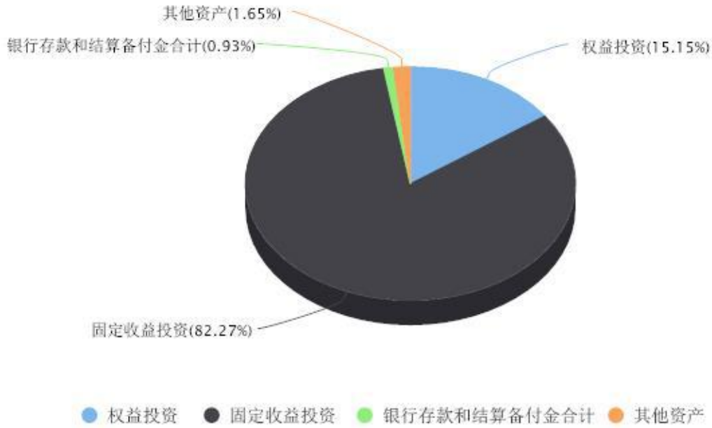
投资组合资产配置图表 数据截止日期:2025年09月30日