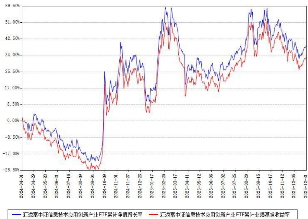
汇添富中证信息技术应用创新产业ETF累计净值增长率与同期业绩基准收益率对比图