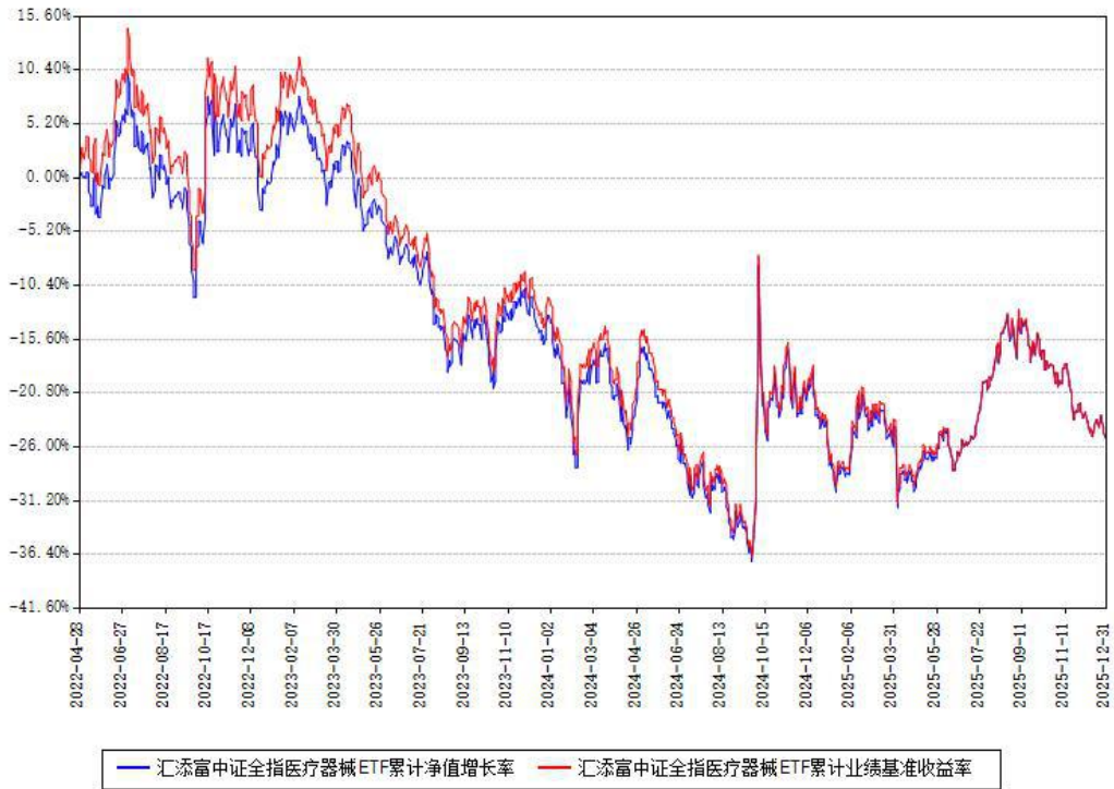
汇添富中证全指医疗器械ETF累计净值增长率与同期业绩基准收益率对比图