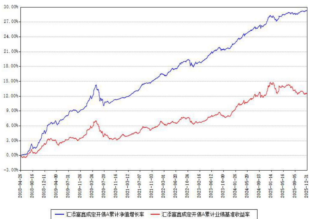
汇添富鑫成定开债A累计净值增长率与同期业绩基准收益率对比图