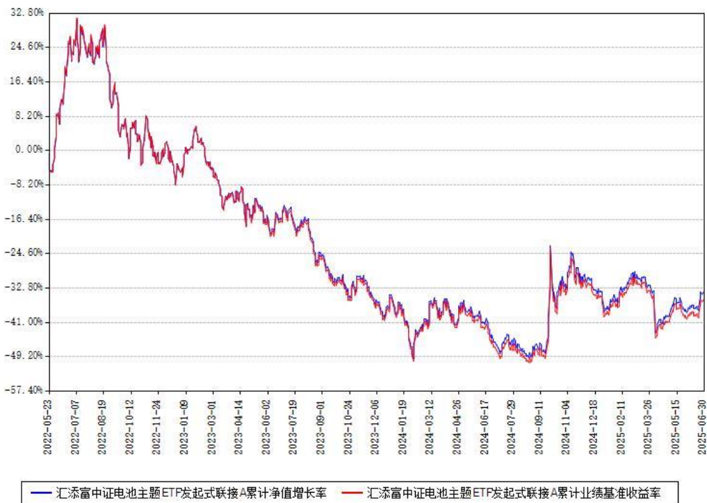
汇添富中证电池主题ETF发起式联接A累计净值增长率与同期业绩基准收益率对比图